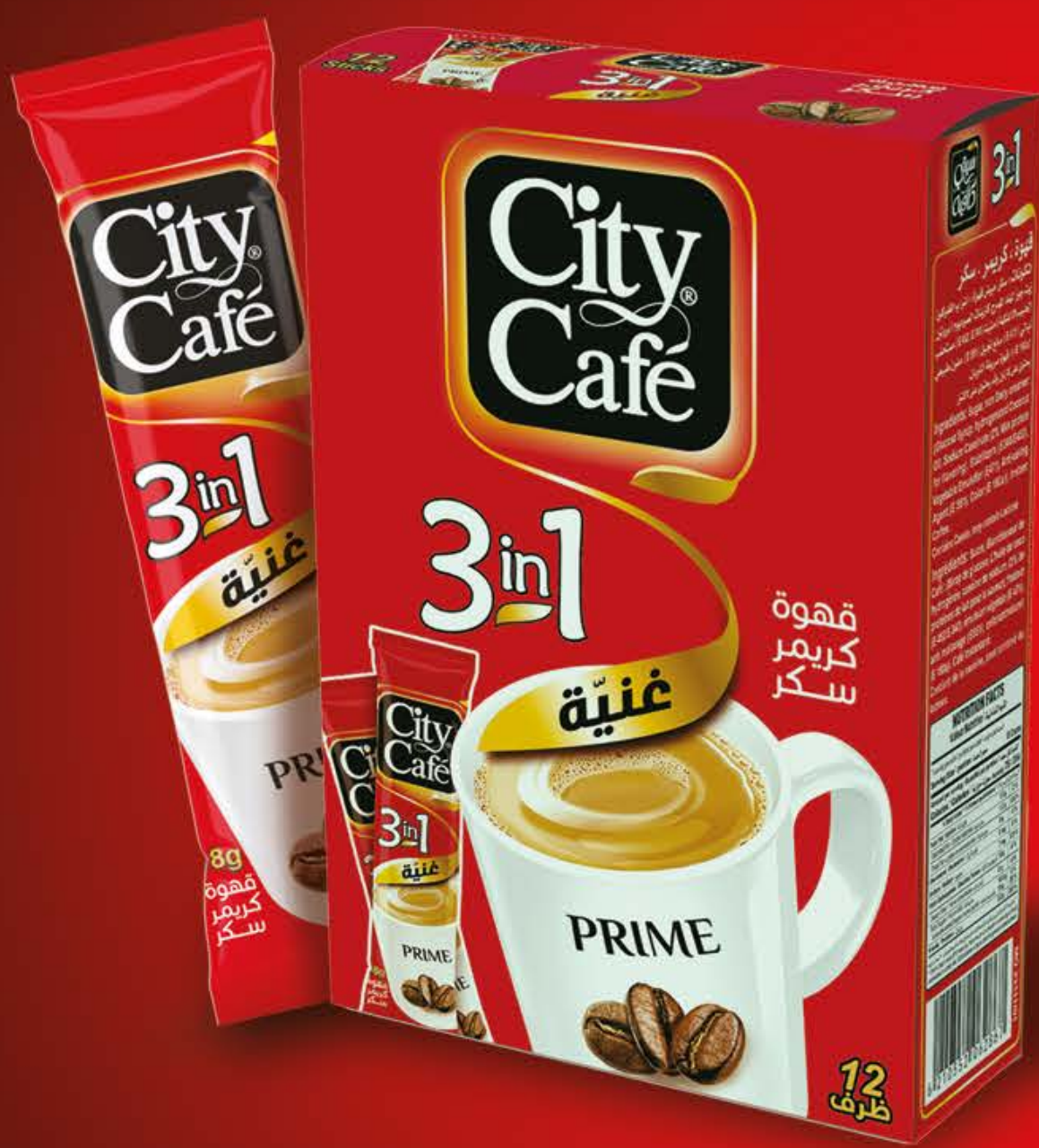
قهوة كريمر سكر Coffee Creamer Sugar