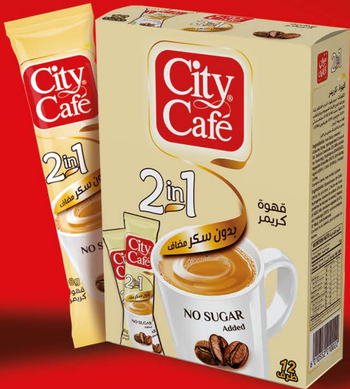
بدون سكر مضاف No Sugar Added